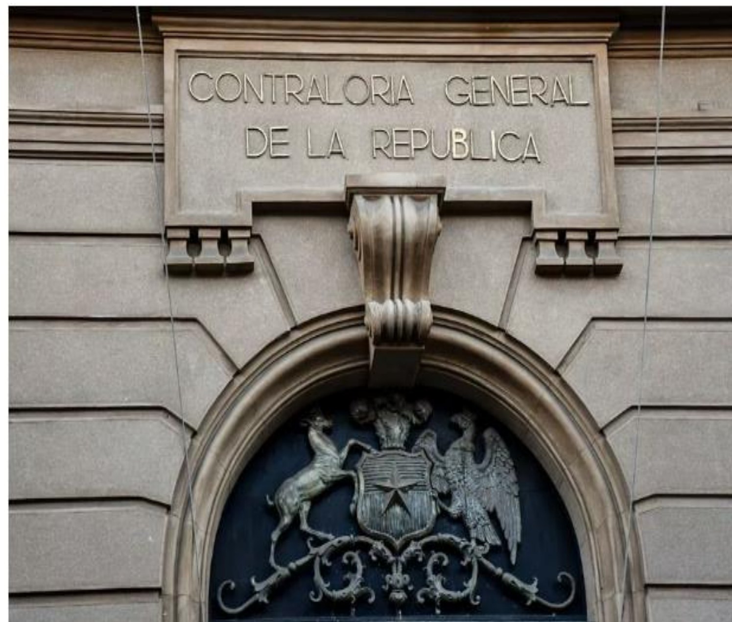
Frontis Contraloría General de la República.

Mediante su cuenta de Twitter, la entidad fiscalizadora aclaró que "no ha evacuado ningún dictamen, pronunciamiento jurídico o resolución" que impida la contratación de servicios de salud. Mientras que, el Minsal respondió que fue una "confusión involuntaria" y que se refería a una inhabilitación de la justicia laboral.