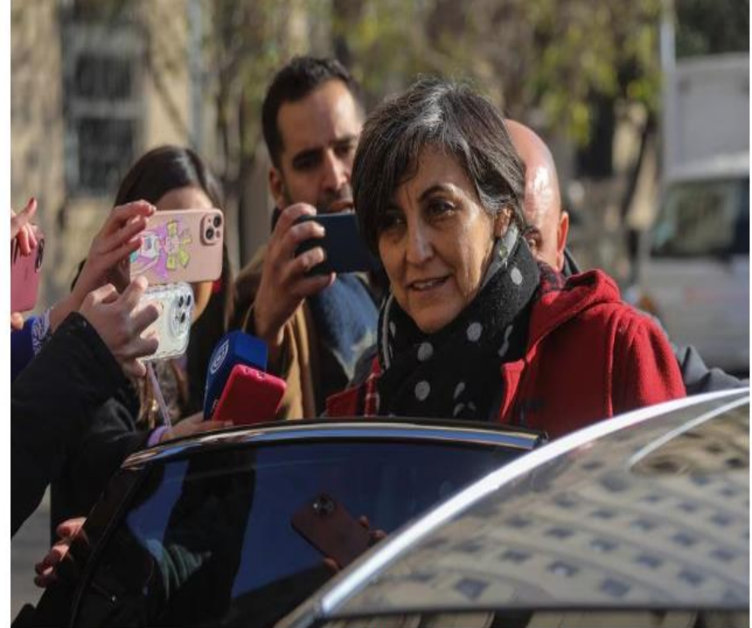
La ministra de Salud, Ximena Aguilera, se retira del Palacio de La Moneda, tras reunirse con el Presidente Gabriel Boric. Foto:

“Nosotros lo que estamos haciendo es estar concentrados en tratar de dar respuesta al brote de virus sincial y creo que esa es la prioridad en este momento”, señaló la titular de Salud en La Moneda.