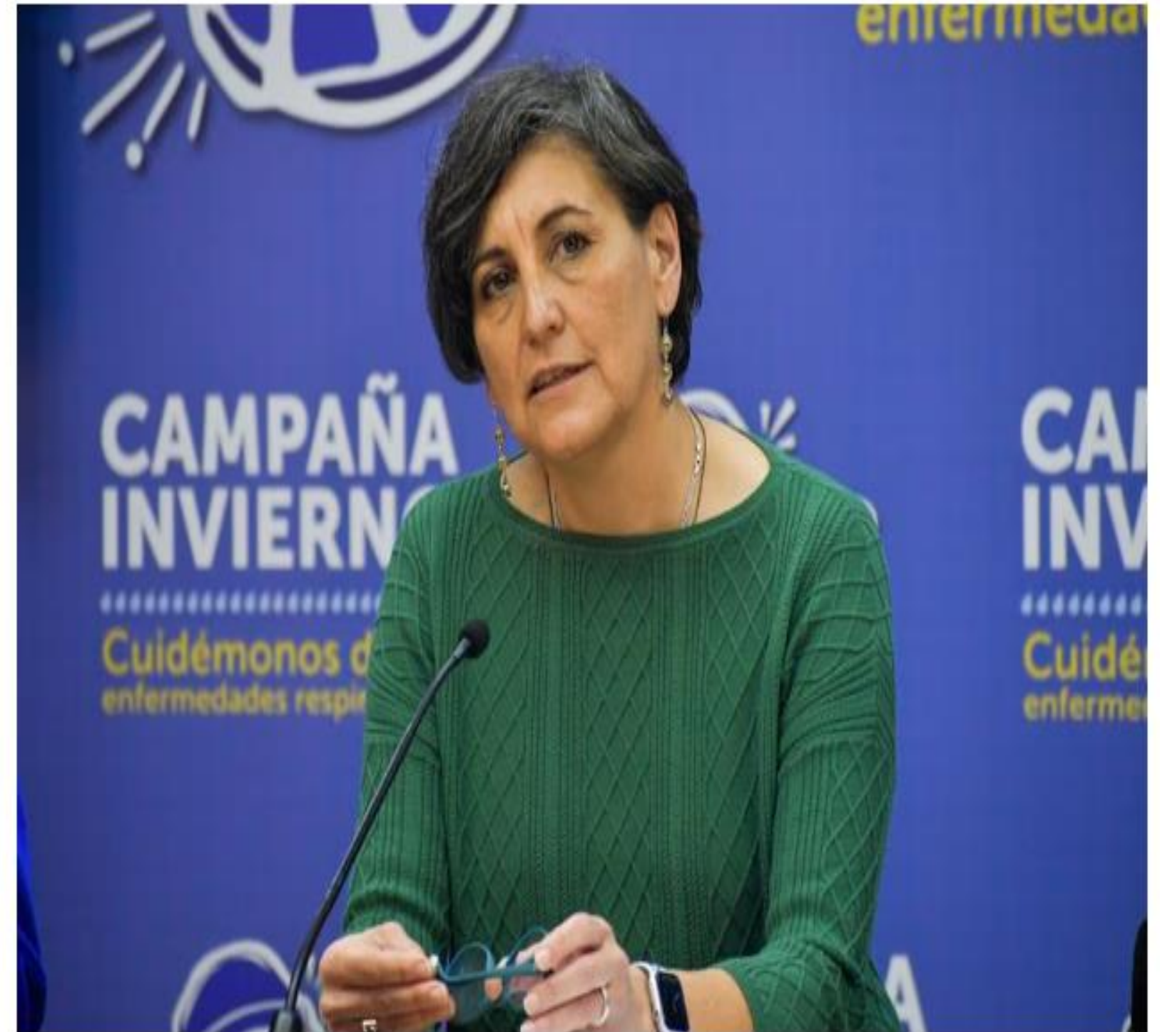
La ministra de Salud, Ximena Aguilera.

Ximena Aguilera lamentó su "frase desafortunada" para referirse al deceso de la bebé y agregó que "no hay ninguna excusa" por esa expresión.