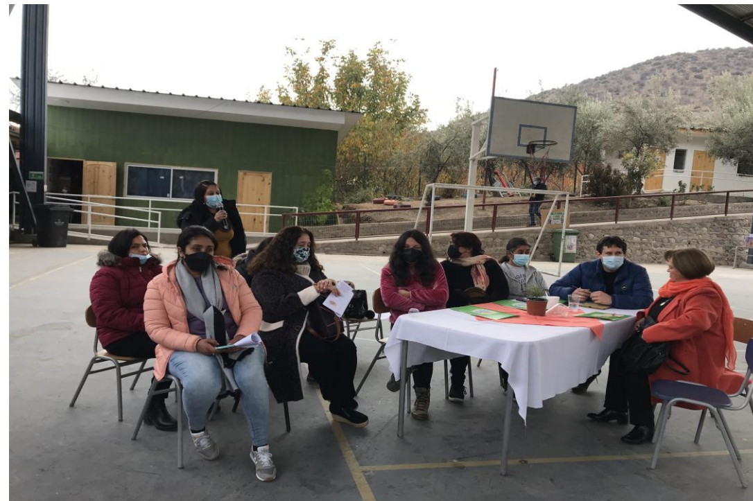
Foto de conversatorio anterior