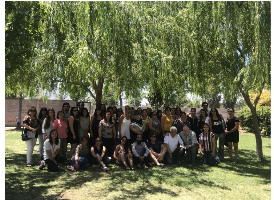
Foto de capacitación anterior