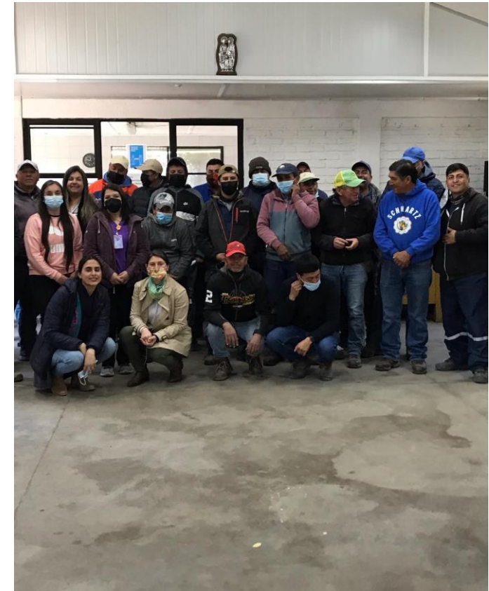
Foto de taller de determinantes sociales a Fundo Santa Rosa actividad realizada año anterior