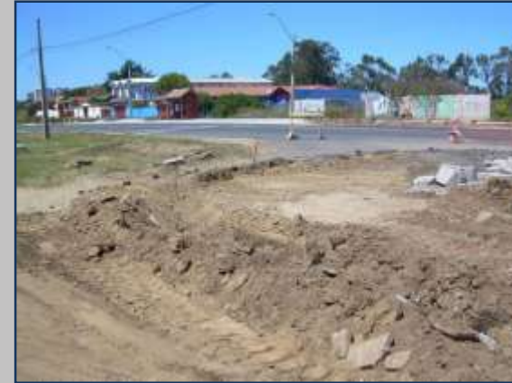
MEJORAMIENTO VEREDAS ENTRE CALLE LIBRA Y BANCO CENTRAL, COMUNA DE EL QUISCO