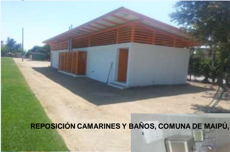
REPOSICIÓN CAMARINES Y BAÑOS, COMUNA DE MAIPÚ,