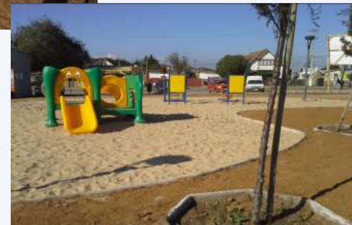
CONSTRUCCIÓN AREAS RECREATIVAS Y DEPORTIVAS, COMUNA EL TABO