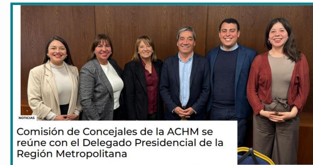
Comisión de Concejales de la ACHM se reúne con el Delegado Presidencial de la Región Metropolitana