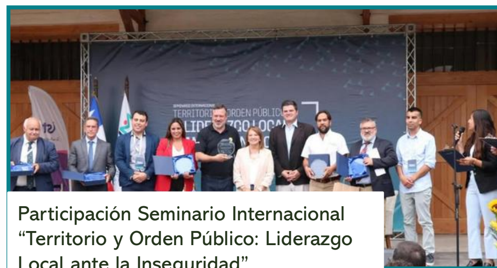
Participación Seminario Internacional "Territorio y Orden Público: Liderazgo Local ante la Inseguridad"