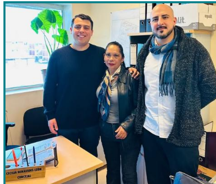
Encuentro junto a concejales de la comuna de Lo Espejo, para trabajar en conjunto en temas seguridad municipal.