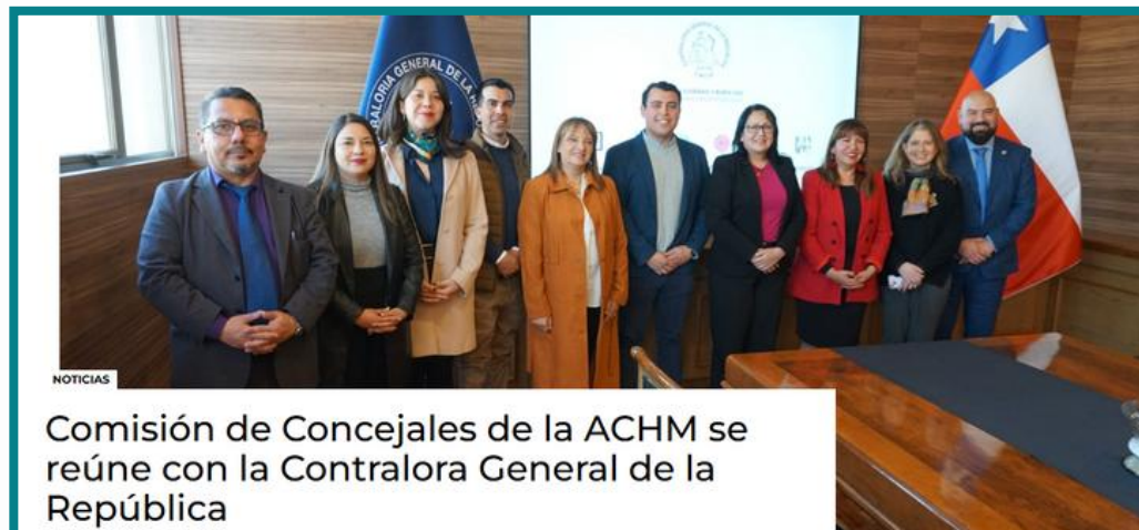
Comisión de Concejales de la ACHM se reúne con la Contralora General de la República