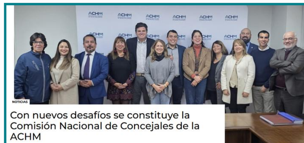
Con nuevos desafíos se constituye la Comisión Nacional de Concejales de la ACHM