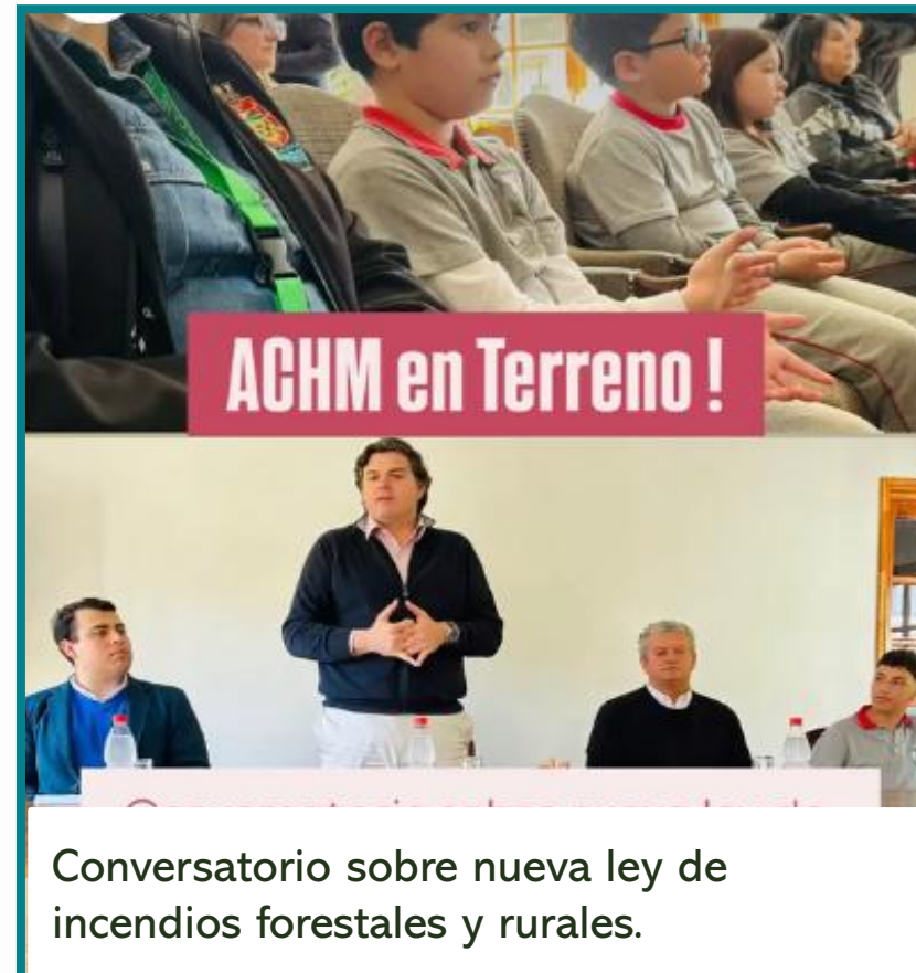
Conversatorio sobre nueva ley de incendios forestales y rurales.