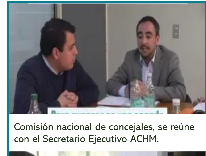
Comisión nacional de concejales, se reúne con el Secretario Ejecutivo ACHM.