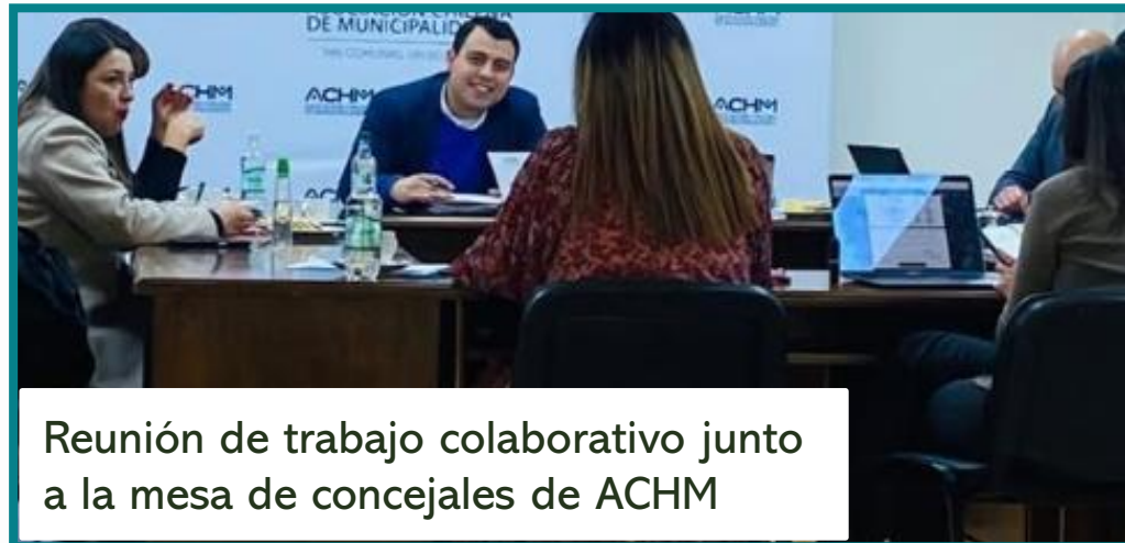
Reunión de trabajo colaborativo junto a la mesa de concejales de ACHM