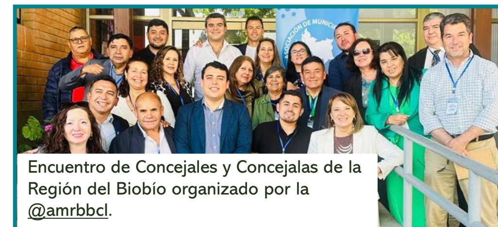
Encuentro de Concejales y Concejales de la Región del Biobío organizado por la @amrbcl .