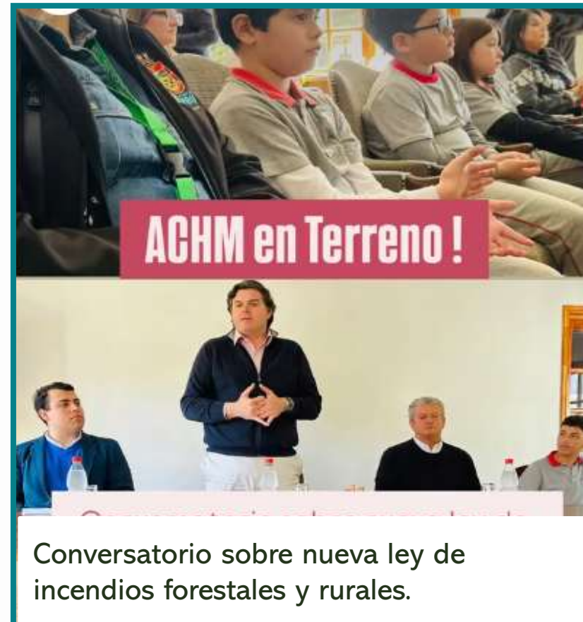
Conversatorio sobre nueva ley de incendios forestales y rurales.