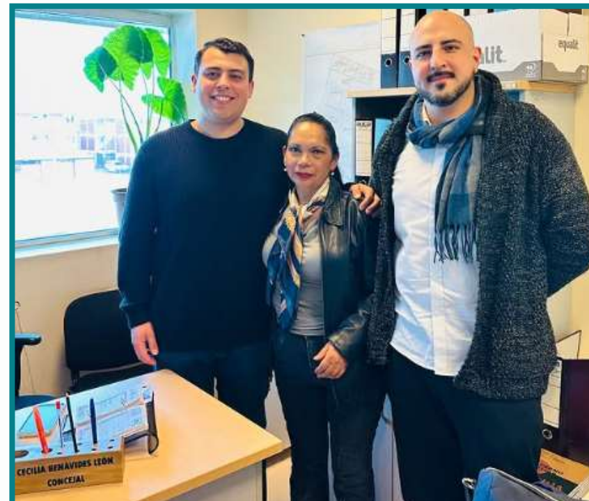
Encuentro junto a concejales de la comuna de Lo Espejo, para trabajar en conjunto en temas seguridad municipal.