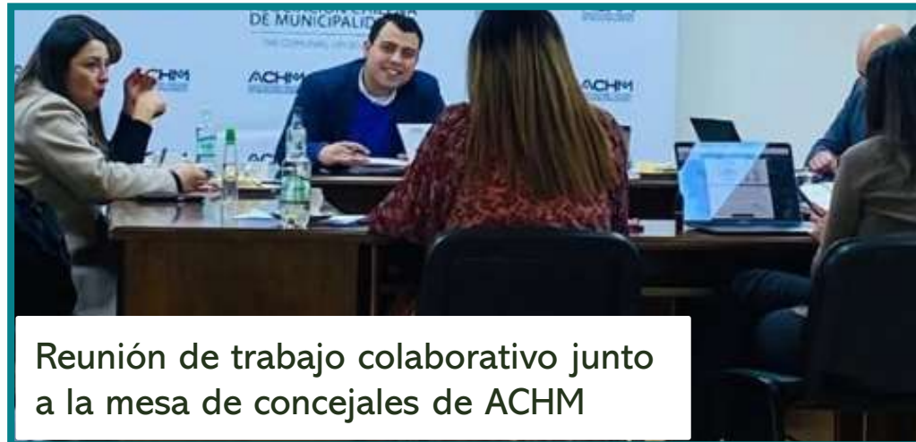
Reunión de trabajo colaborativo junto a la mesa de concejales de ACHM