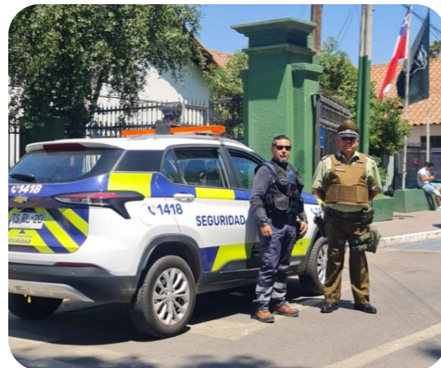
Patrulla Mixta 25° Comisaría Maipú

En la actualidad se mantienen 124 P.N.I. llamados al servicio en diferentes unidades del país desempeñando servicios de Patrullajes Mixto