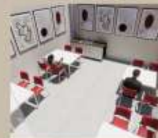
Zona de cafetería