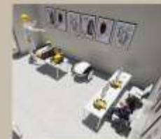
Zona de Laboratorio 1