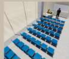
Zona de exposición