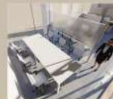
Zona de reuniones