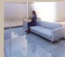
Zona de espera