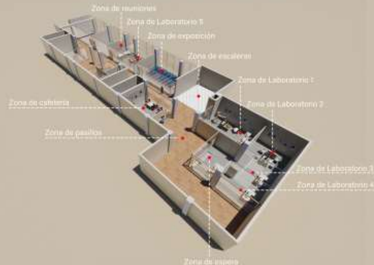
Centro de Innovación-Arena Puerto Montt.

Foco: acuicultura, agroindustria, construcción y turismo.