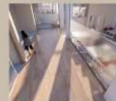
Zona de pasillos